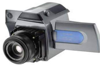
INPROTEC AVIO TVS 500